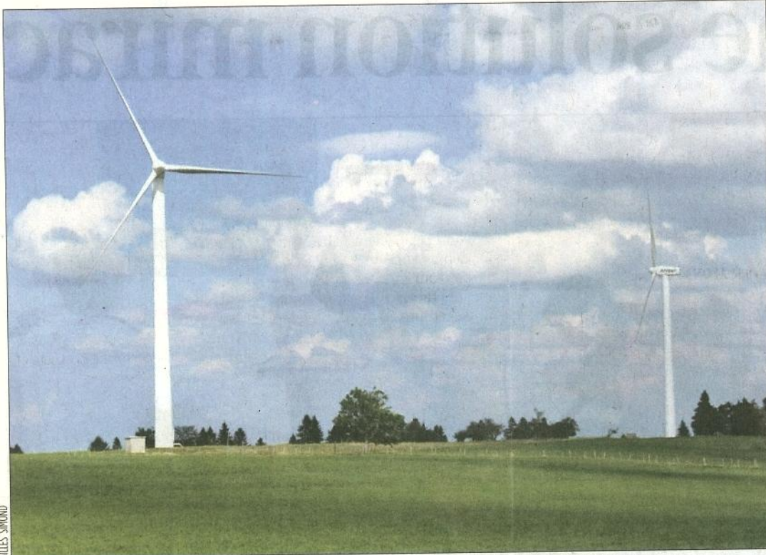
SITES Les éoliennes du Mont-Crosin, dans le Jura bernois. Certaines voix, de plus en plus fortes, refusent de voir se multiplier les ventilateurs géants sur les crêtes jurassiennes.